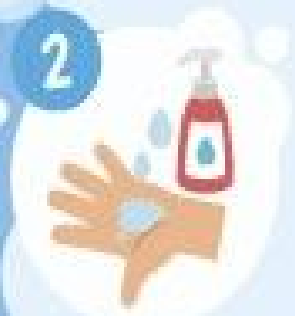
Je mets un peu de savon