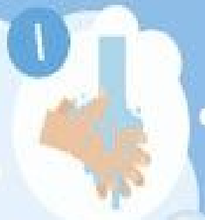
Je mouille mes mains