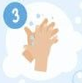
Je frotte les paumes