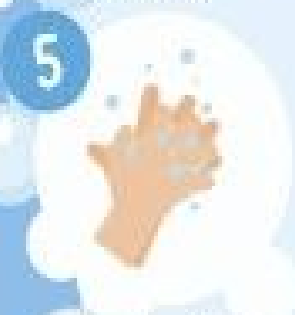
entre les doigts