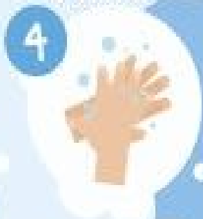
le dos des mains