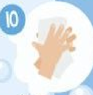
J'essuie mes mains correctement!